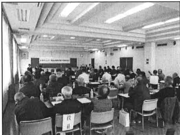
申請報告会の様子