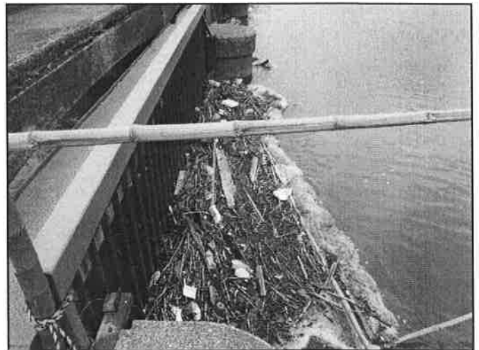
↑ 備前渠用水路の取入口に溜まったゴミ

水路や堤塘敷などの土地改良区施設は、組合員皆さんの大切な財産であり、ゴミ捨て場ではありません。組合員の皆さんや地域の方々のご協力をお願いします。