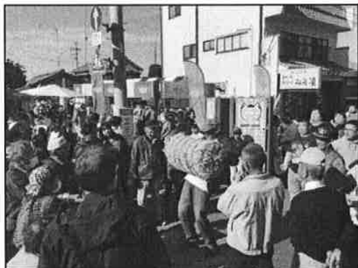
深谷市産業祭の様子

備前渠用水路ブースの中では、備前渠用水路を紹介するDVDを流して来場された方に見て頂いたり、「米一俵にチャレンジ」と銘打って、米俵を持ち上げた人にはお米をプレゼントしました。他にも、メダカの販売、彼岸花の球根の無料配布等を行いました。