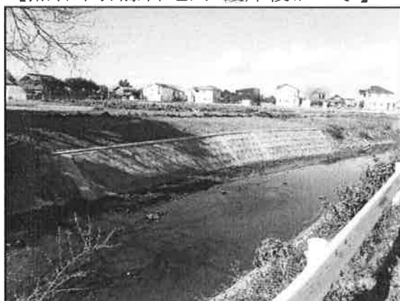
【熊谷市弥藤吾地内 護岸復旧工事】